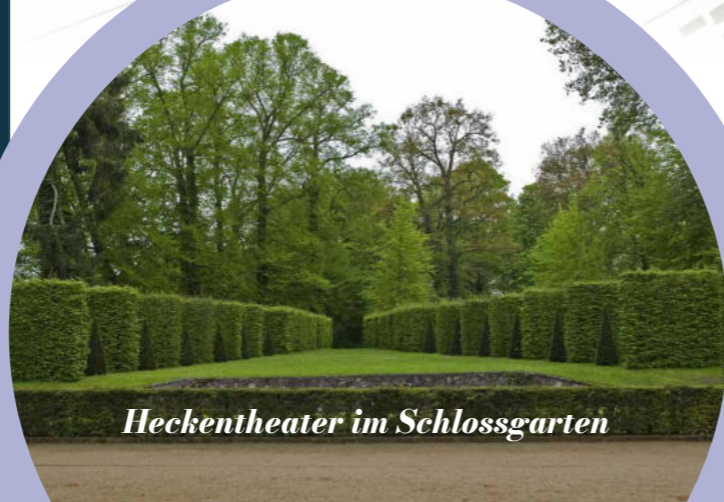
Heckentheater im Schlossgarten