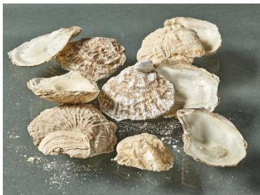
Abb. 5 Austernschalen, die in den 1990er Jahren aus dem Wassergraben um das Schloss Rheinsberg geborgen wurden. Sie stammen vermutlich aus dem Abfall der Hofküche.