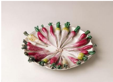
Abb. 4 Manufaktur Paul Hannong, Straßburg, Schaugericht in Form eines Tellers mit geputzten, roten und weißen Rettichen, zwischen 1754–1762, Fayence