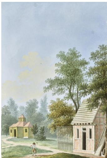
Abb. 6 Carl Benjamin Schwarz, Geflügelzucht oder Poulaillerie vor dem Rheinsberger Glashüttentor, um 1792, Gouache